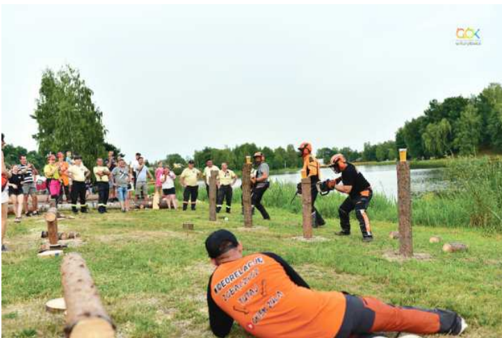
Gminny Ośrodek Kultury i Biblioteka w Kuryłówce. Organizatorzy bardzo dziękują publiczności, która