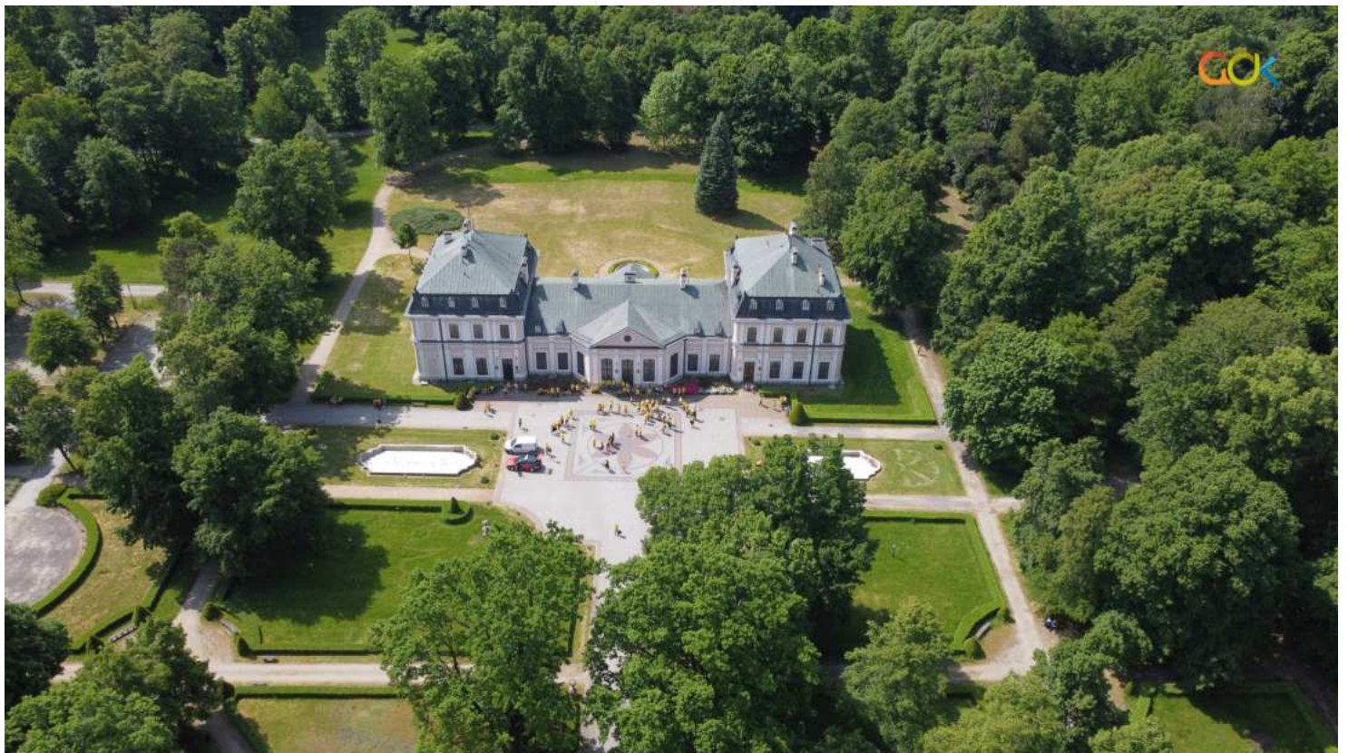
Pałac w Sieniawie